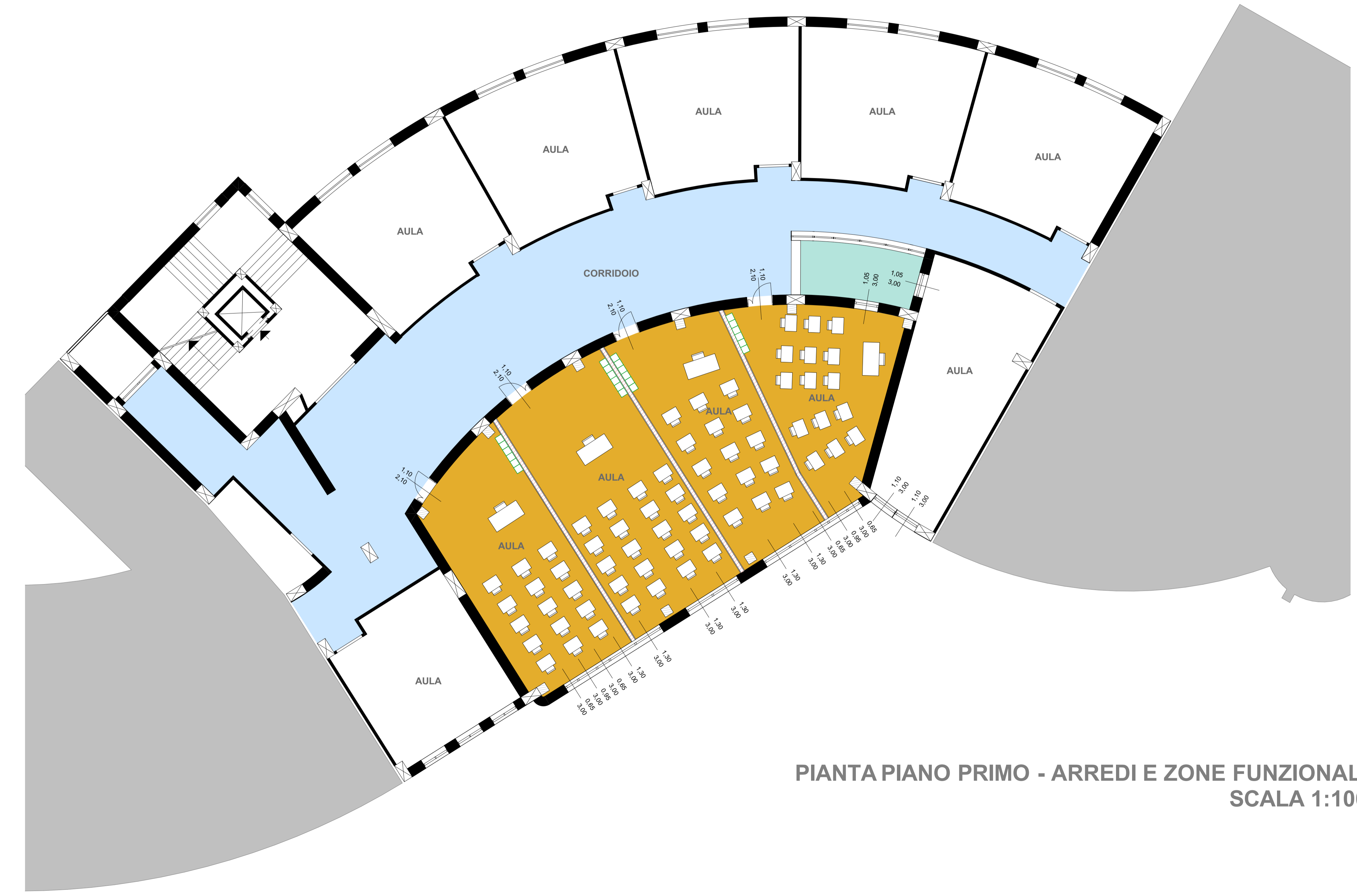
PIANTA PIANO PRIMO - ARREDI E ZONE FUNZIONALI SCALA 1:100